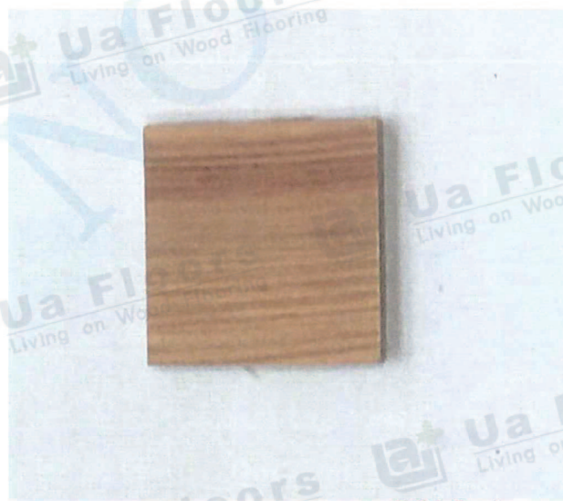
照片 1：誌懋股份有限公司 檢測樣品 1